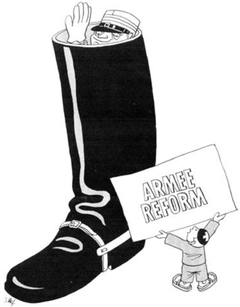
«I bi gäng nid diheima!» Nebelspalter, 1. August 1946