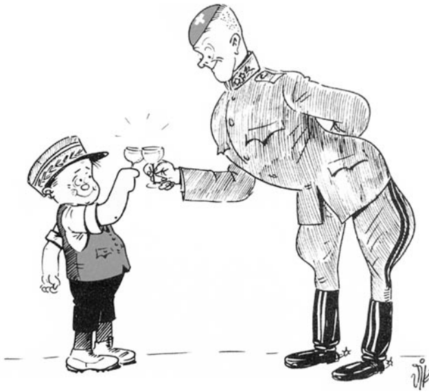
«Dik wünscht zum Neujahr: ein Zeichen guten Einvernehmens zwischen Volk und Armee» Nebelspalter, 26. Dezember 1946